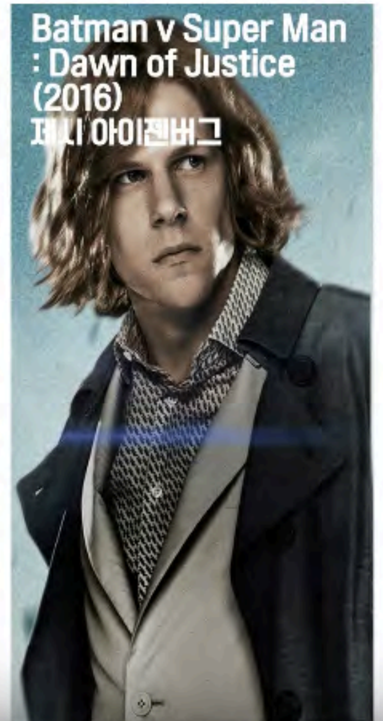
슈퍼맨의 악당, 렉스 루터